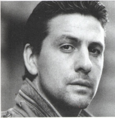
Der Schauspieler: Gregor Törzs